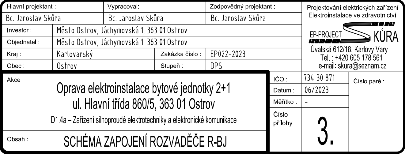
Schéma zapojení rozvaděčů

akce : Oprava elektroinstalace bytové jednotky, ul. Hlavní třída 860/5, 363 01 Ostrov